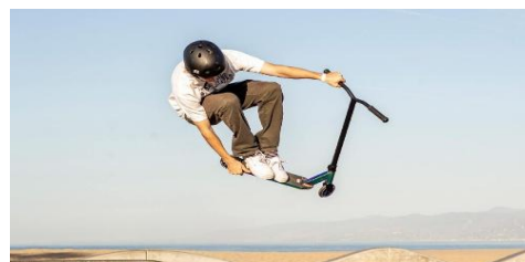
Autor: Szymon Tyski kl.8a

Moja przygoda z hulajnogą jeszcze chyba nie dobiega końca, a na pewno nie mam takich planów. Hulajnoga to najlepsza rzecz jaką mnie spotkała w życiu, dzięki niej mam wielu wspaniałych przyjaciół i wiele pięknych rzeczy mnie spotkało.